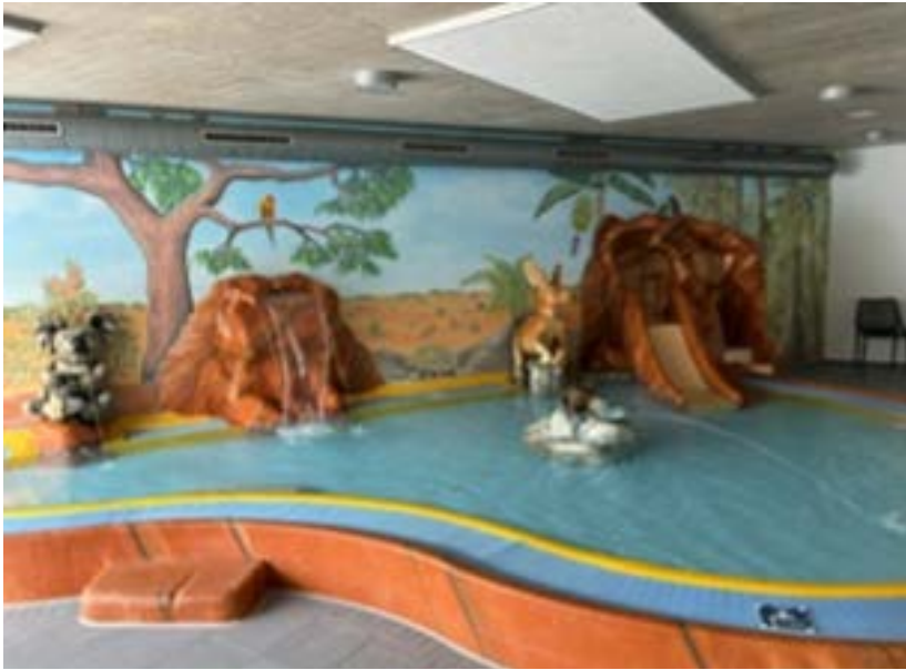
Links des Hauptbeckens befindet sich der Kinder- und Babybereich. Wassertiefe: 0,30 m