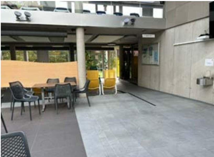
Das Atrium (Foto) und die Gastronomie des Hallenbades Olympisches Dorf befinden sich neben dem Hauptbecken. Der Zutritt erfolgt über die automatische Schiebetüre (Sensor). Der barrierefreie Liegebereich ist durch eine Rampe beidseitig mit dem Atrium verbunden.