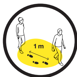
1 m Abstand zu anderen Personen 1 m Abstand in der Dusche