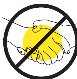
Verzichten Sie auf Händeschütteln und Umarmungen

Bitte beachten Sie die Anweisungen unseres Bäderpersonals.