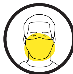
FFP2-Masken beim Betreten der WC-Anlagen und in geschlossenen Räumen