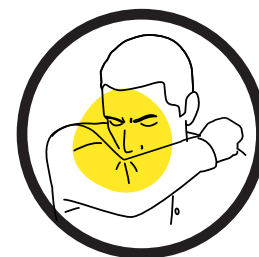
Niesen und Husten in die Armbeuge