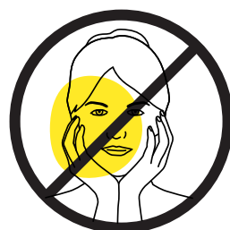
Hände aus dem Gesicht